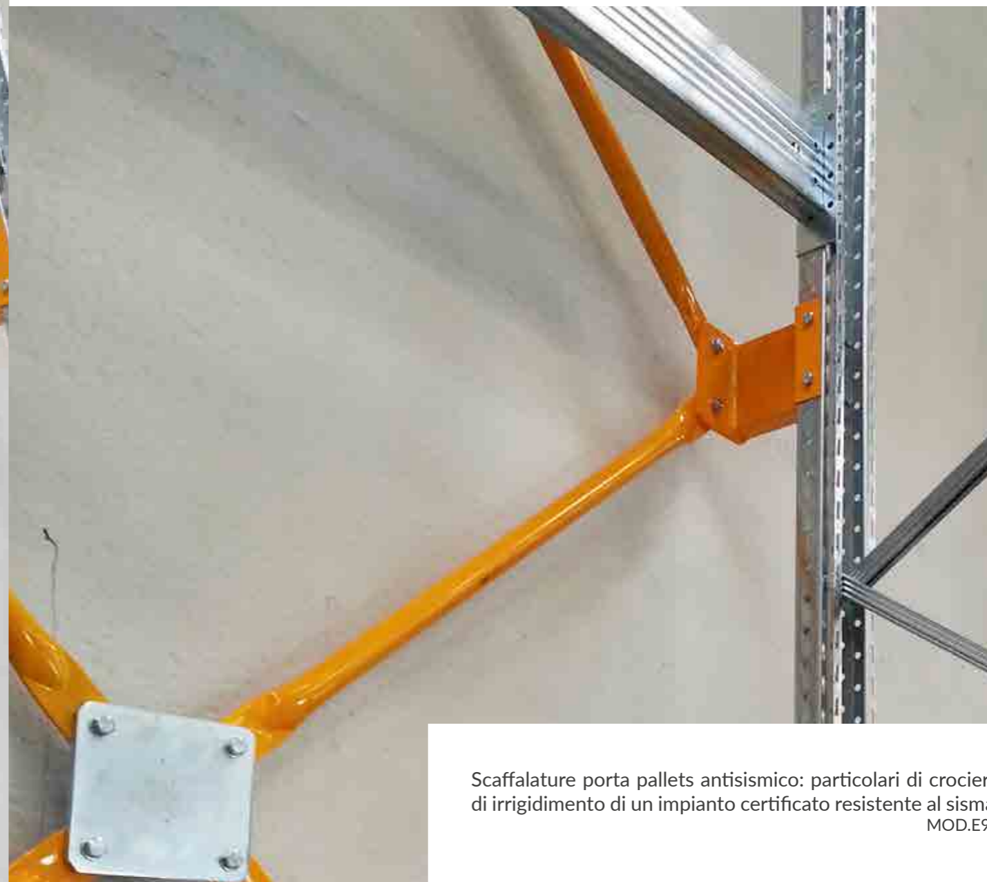
Scaffalature porta pallets antisismico: particolari di crociere di irrigidimento di un impianto certificato resistente al sisma. MOD.E90